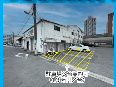
駐車場3台契約可 (1.3万円/台)