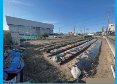
府道174号線沿で交通量の多い立地です◎