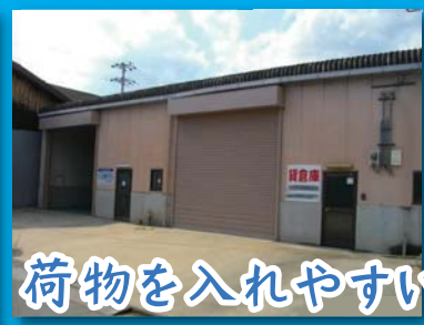
荷物を入れやすい大きなシャッター!