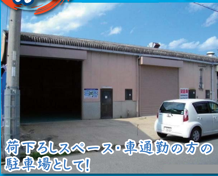
荷下ろしスペース・車通勤の方の 駐車場として!